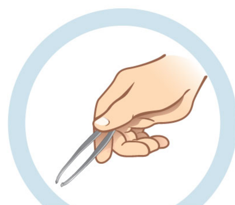
1. ИСПОЛЬЗУЙТЕ ПИНЦЕТ

ПО ВОЗМОЖНОСТИ СРАЗУ ОБРАЩАЙТЕСЬ К ВРАЧУ