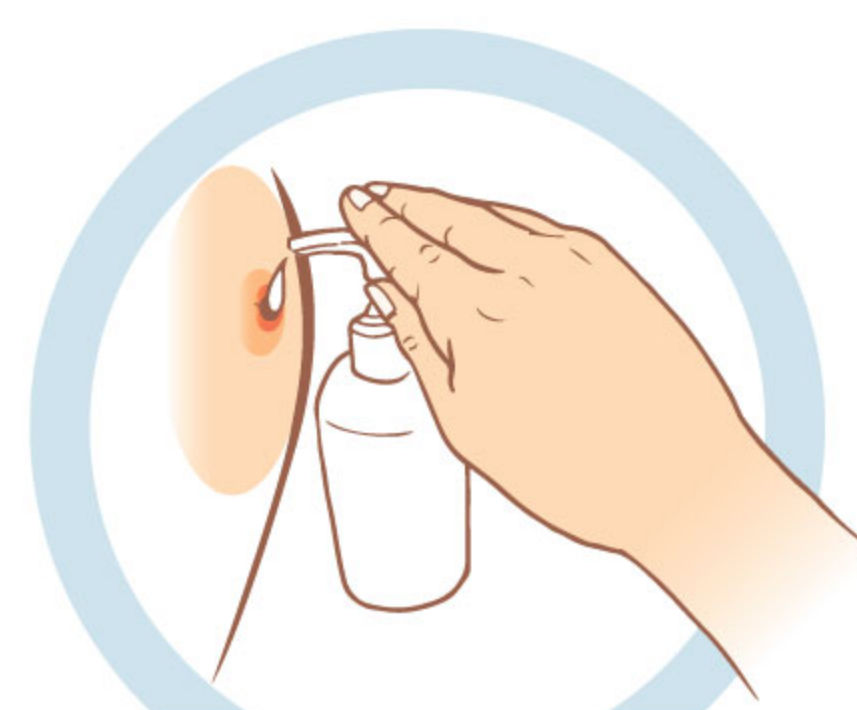
2. ПРОДЕЗИНФИЦИРУЙТЕ МЕСТО УКУСА