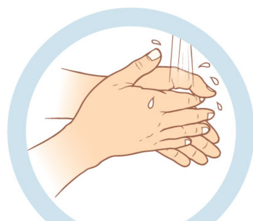
3. ТЩАТЕЛЬНО ПРОМОЙТЕ РУКИ С МЫЛОМ